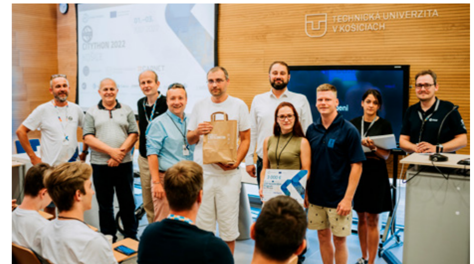
Vítaný tím „StorePredictor“.