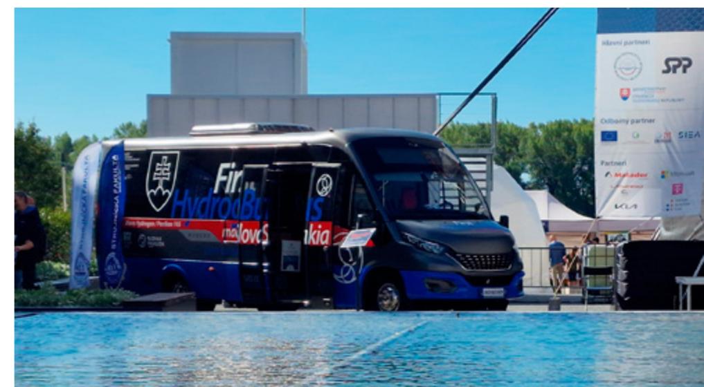
Prvý vodíkový nízkotlakový autobus využívajúci na uskladnenie vodíka metalhydridové materiály vytvorený v spolupráci Sjf TUKE a firmy ROŠERO-P, s. r. o.