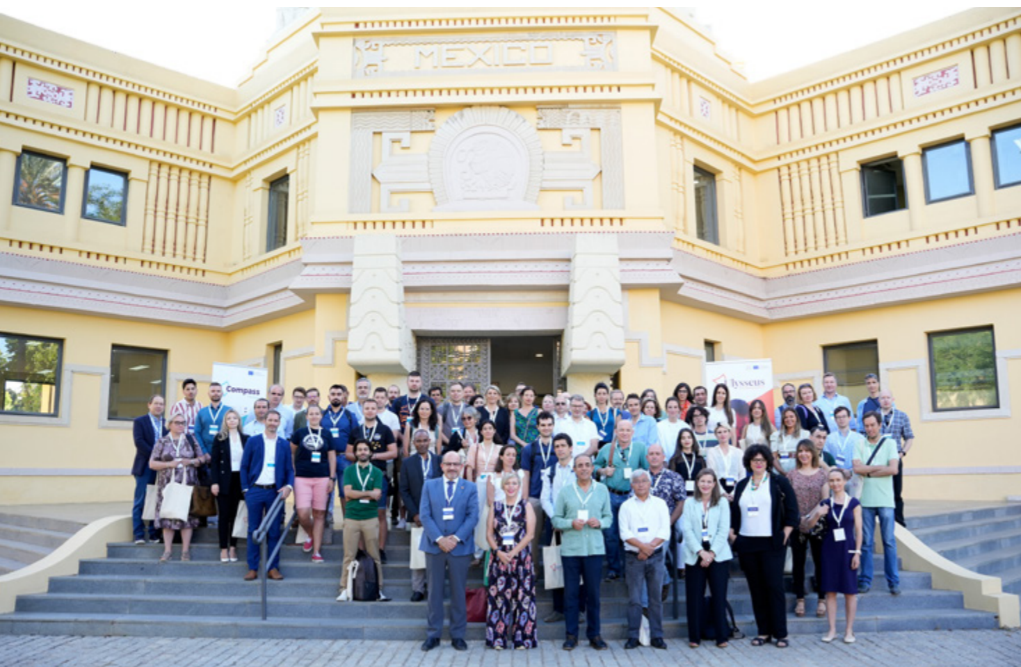
Spoločná fotografia účastníkov podujatia.

V dňoch 22. – 23. júna 2022 sa viac ako 100 výskumníkov stretlo na podujatí DNI VÝSKUMNÍKOV v španielskej Seville s cieľom nadviazať vzájomné kontakty pre budúce spoločné výskumné a projektové aktivity. Výskumníci z našej Technickej univerzity v Košiciach (TUKE), Univerzity v Seville (Španielsko),