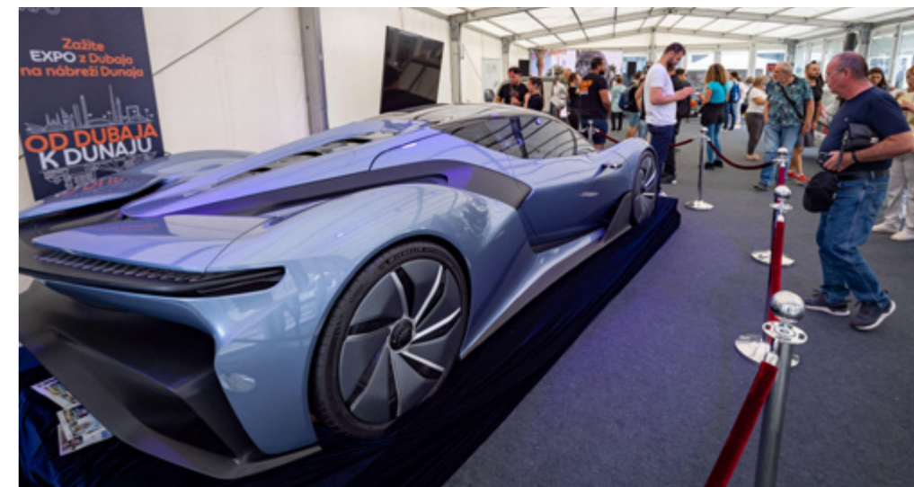
Koncept vodíkového superšportového auta vyvinutého v spolupráci Sjf TUKE a Matador Group