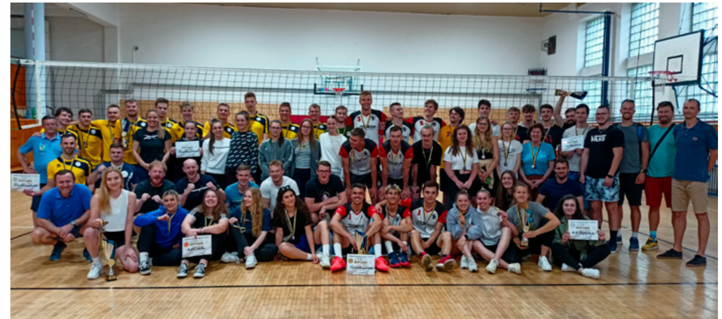
Spoločné foto zúčastnených družstiev

V dňoch 25. – 26. 5. 2022 sa na pôde Technickej univerzity v Košiciach uskutočnili Akademické majstrovstvá Slovenska vo volejbale mužov a žien . Turnaj organizovalo Oddelenie akademického športu a Akademik Technická univerzita Košice s finančnou podporou Slovenskej asociácie univerzitného športu a Ministerstva školstva, vedy, výskumu a športu SR. O titul Akademický majster Slovenska súperili štyri družstvá mužov a štyri družstvá žien. Turnaj sa hral systémom každý s každým na tri hrané sety, pričom každý získaný set znamenal bod do tabuľky. Turnajový systém v takejto forme sa na Akademických majstrovstvách hral po prvýkrát, pričom cieľom systému bolo, aby sa družstvá stretli s každým súperom, a zároveň aby to neznamenal prílišnú časovú náročnosť turnaja. Najúspešnejšou