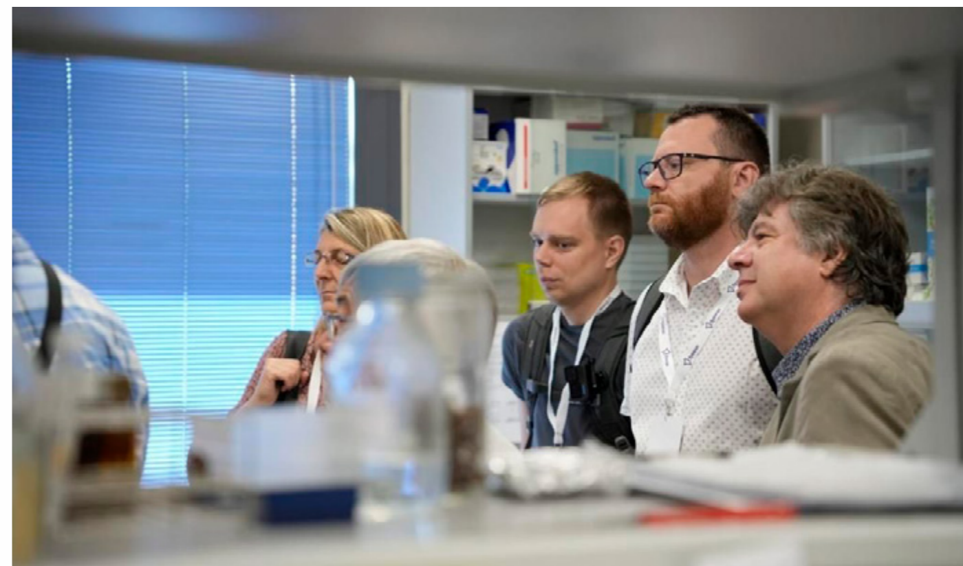
Výskumníci na návšteve excelentného pracoviska na Univerzite v Seville.

Univerzita v Seville (USE) v rámci satelitného projektu COMPASS aliancie Ulysseus. Podujatie umožnilo výskumníkom nadviazať bližšie vzájomné kontakty, spoznať aktuálne oblasti výskumu a vývoja a využiť príležitosti na rozvoj budúcich spoločných európskych projektov a vedeckých a výskumných aktivít.