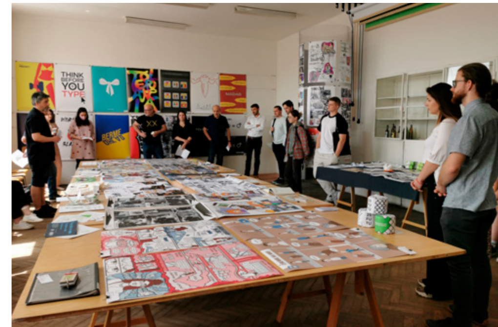
Obhajoby semestrálnych prác.

Obhajoby semestrálnych a záverečných prác prebiehajú na Katedre dizajnu, ako aj na ďalších katedrách Fakulty umení, v rámci ateliérovej výuky , ktorá je nosnou časťou umeleckého vzdelávania. Študenti pracujú pod vedením pedagógov, školiteľov a konzultantov na viacerých projektoch alebo na svojej záverečnej práci, konzultujú jednotlivé koncepty, následne vytvárajú prototypy v skutočnej veľkosti alebo v zmenšenej mierke (v závislosti od charakteru projektu), až napokon vyhotovia finálne riešenie danej témy. Výstupy ich semestrálnych a záverečných prác následne prezentujú komisii zloženej z pedagógov Katedry dizajnu, resp. iných vysokých umeleckých škôl, ako aj odborníkov z praxe. Počas obhajob študenti získavajú nielen cennú spätnú väzbu od skúsených a etablovaných dizajnérov, ale pripravujú sa aj na prezentovanie svojej práce v budúcnosti pred klientmi či kolegami v zamestnaní. Obhájené práce študentov Katedry dizajnu boli po dvojročnej pandemickej prestávke tento rok opäť sprístupnené aj širokej verejnosti v rámci Dní otvorených dverí (27. – 28. 5. 2022) priamo v ateliéroch Katedry dizajnu